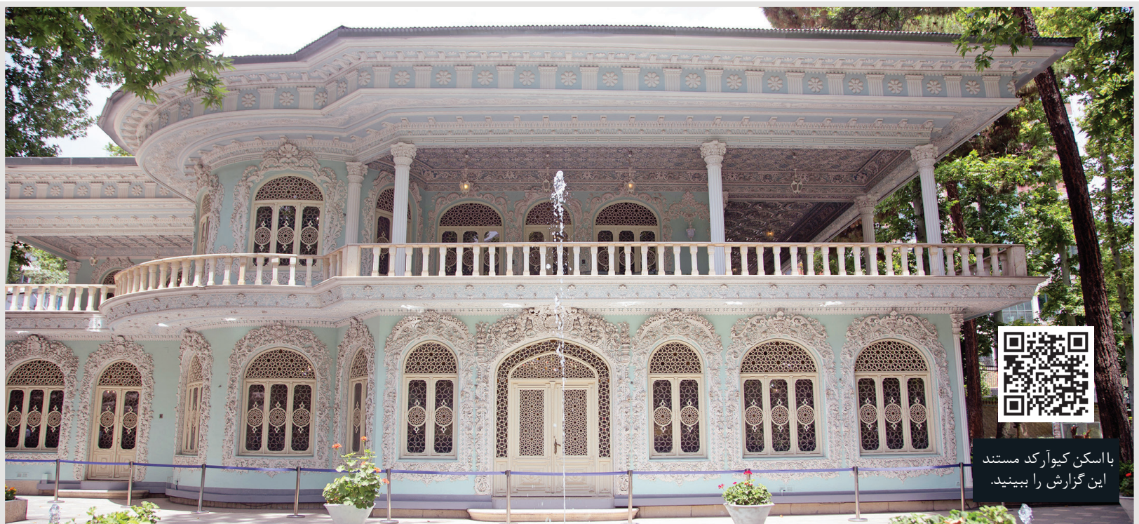
با اسکن کیوآر کد مستند این گزارش را ببینید.