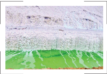
اولین آبشار نمکی جهان

دهکده و آبشار نمکی پتاس و بیابانک از حدود ۵۰ سال پیش ایجاد شده. در آن زمان، مجتمع معدنی پتاس در این منطقه شروع به فعالیت کرد و در نتیجه فعالیت این مجتمع، دریاچه نمک پتاس در مجاورت آن ایجاد شد. این دریاچه بر اثر تخریب آب، باعث رسوب نمک‌های معدنی در خود می‌شد و با این رسوب گذاری آبشار نمکی پتاس را ایجاد کرد.