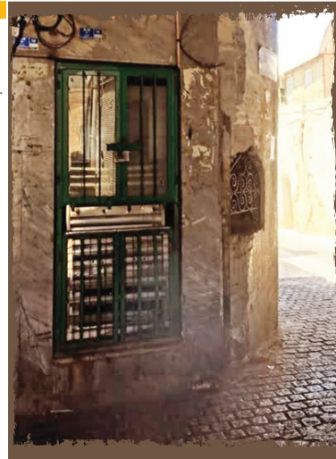
سقاخانه نامی السلطنه