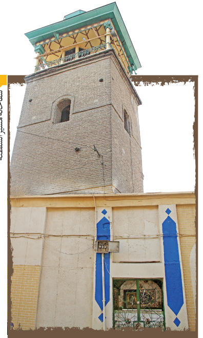
سقاخانه مشیر السلطنه