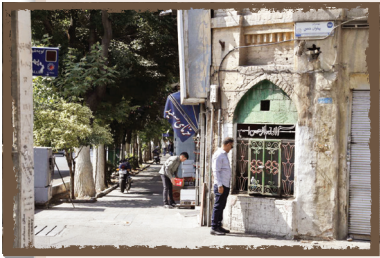
نام: سقاخانه مسجد قندی موقعیت: محله خانی آباد، خیابان تختی، خیابان پهلوان حسن