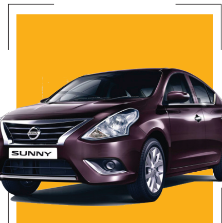
ارزان ترین خودروی وارداتی ارزان ترین خودروی وارداتی در سامانه یکپارچه، خودروی نیسان سانی است که به قیمت یک میلیارد و ۱۰۷ میلیون تومان عرضه شده است.