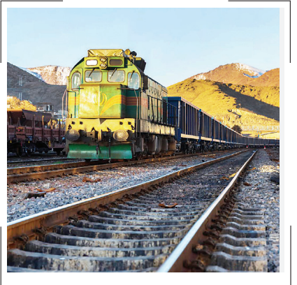
محموله سیمان صادراتی روی ریل بندر کاسپین

نخستین محموله سیمان صادراتی ریلی- دریایی، با استفاده از واگن‌های شرکت حمل‌ونقل ترکیبی گروه کشن‌تریان جمهوری اسلامی ایران از بندر کاسپین روانه بازارهای کشورهای حاشیه دریای خزر شد.