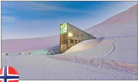
انبار بذر سوالبارد - نروژ

کشاورزان در سال ۱۹۷۴ مقبره «چین شی هوانگ» نخستین امپراتور چین را کشف کردند و از آن زمان باستان‌شناسان حدود ۲ هزار سرباز سفالی را پیدا کرده‌اند و فکر می‌کنند که هنوز حدود ۸ هزار سرباز دیگر نیز می‌تواند کشف شود. با وجود این اکتشافات، دولت چین به باستان‌شناسان اجازه نداده است که به مقبره مرکزی که بدن «چین شی هوانگ» در آن قرار دارد دست بزنند. مقبره‌ای که از سال ۲۱۰ قبل از میلاد بسته بوده است. این تصمیم برای احترام به مردگان و همچنین به دلیل ترس از آسیب‌رسیدن به آثار باستانی گرفته شده‌است.