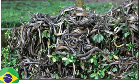
جزیره مارها - برزیل

جزیره «ایلادا کوئیمادا گراند» در برزیل که به جزیره مارها معروف است، خانه‌ای برای جمعیت انبوه یکی از مرگبارترین مارهای جهان است. زهر افعی سرسبز نوزاد طلایی به حدی سمی است که گوشت انسان را در اطراف محل گزش، ذوب می‌کند و برخی ادعا می‌کنند که در برخی مناطق این جزیره، در هر متر مربع یک مار وجود دارد. به دلایل ایمنی، دولت برزیل اجازه ورود بازدیدکنندگان را نمی‌دهد و هر تیم تحقیقاتی که به این جزیره می‌رود، باید حتماً یک پزشک همراه داشته باشد.