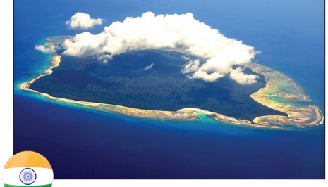
جزیره سنتینل شمالی - هند

سیاره‌ای که در آن زندگی می‌کنیم، محلی پر رمز و راز است. برخی از مکان‌های عجیب و راز آلود البته به دست خود بشر به شکل کنونی درآمده‌اند. در