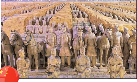
مقبره چین شی هوانگ - چین

ساکنان قبیله سنتینلی‌های جزیره سنتینل شمالی در نزدیکی هند احتمالاً حدود ۶۰ هزار سال است که آنجا زندگی می‌کنند و کاملاً از جامعه جهانی جدا مانده‌اند. در سال ۲۰۰۶، قایق ۲ ماهیگیر به سواحل این جزیره رسید که سنتینلی‌ها آن دورا کشند. گزارش‌های دیگری مبنی بر تیزاندازی به باگ‌دهای عبوری نیز وجود داشته است. به دلیل اینکه سنتینلی‌ها به بیماری‌هایی که دیگران مقابلشان مقاومت یافته‌اند مبتلا نشده‌اند، تماس با افراد خارجی می‌تواند برای قبیله مرگبار باشد. دولت هند توافق کرده که هیچ تلاشی برای برقراری تماس با اهالی این قبیله انجام ندهد.