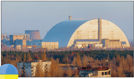
چرنوبیل - اوکراین

جزیره «ایلادا کوئیمادا گراند» در برزیل که به جزیره مارها معروف است، خانه‌ای برای جمعیت انبوه یکی از مرگبارترین مارهای جهان است. زهر افعی سرسبز نوزاد طلایی به حدی سمی است که گوشت انسان را در اطراف محل گزش، ذوب می‌کند و برخی ادعا می‌کنند که در برخی مناطق این جزیره، در هر متر مربع یک مار وجود دارد. به دلایل ایمنی، دولت برزیل اجازه ورود بازدیدکنندگان را نمی‌دهد و هر تیم تحقیقاتی که به این جزیره می‌رود، باید حتماً یک پزشک همراه داشته باشد.