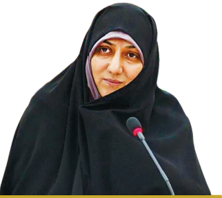
نتایج طرح ۹ گام تربیتی

اجرای طرح ۹ گام تربیتی، آموزشی و درمانی باعث کاهش حضور معاندان متجاهر در سطح شهر شده است. به گزارش متولیان سازمان خدمات و مشارکت های اجتماعی با اجرای این برنامه ها پس از خروج معاندان از یاور شهرها آمار بازگشت آنها به سمت اعتیاد کاهش چشمگیری داشته است. شناسایی و ساماندهی این قشر آسیب دیده در سطح شهر ادامه دارد و این مراکز در طول شبانه روز اقدام به پذیرش و آموزش این افراد خواهند کرد.