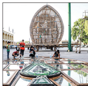
بیش از ۷۰۰ سال قدمت دارد.

طبق یک سنت دیرینه آیین نخل‌بندی در آخرین جمعه قبل از ماه محرم در شهرهای مختلف از جمله یزد برگزار می‌شود. در این آیین معنوی براساس یک سنت ارزشمند، مردم با حضور در حسینیه یا چاووشی‌خوانی و ذکر مصایب اهل بیت (ع) آیین و پارچه‌های مخصوص را به نخل می‌بندند. نخل وسیله‌ای چوبی است که ۲ طرف آن به صورت مشبک، از چوب ساخته