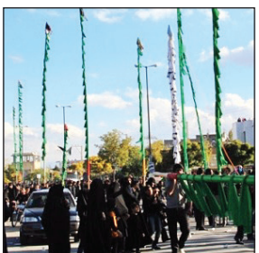
درخت موردنظر را بریده به حسینیه می‌برند.

در جالشر لرستان، پس از برافراشتن علم حسینیه، علم را در کوچه‌های جالشر به حرکت درمی‌آورند و آن راه در خانه‌هایی که تازه عروس و داماد دارند، می‌رسانند تا در آنجا نوحه‌سرایی کنند. آنها اعتقاد دارند که این زوج جوان به دلیل احترام به علم حسینیه، تا آخر عمر سعادت‌مند کنار هم زندگی خواهند کرد. در روستای خمیس اردبیل که شغل بیشتر اهالی آن