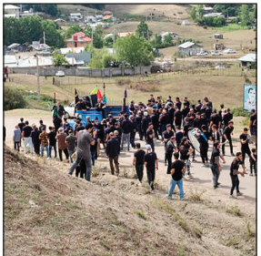
از آغاز ماه محرم، کودکان در کوچه‌ها راه می‌افتند حرکت می‌کنند و چاووشی می‌خوانند.

در بیشتر شهرهای کشور، نخستین بیک‌هایی که خیر نزدیک شدن محرم را به گوش مردم می‌رسانند، کودکان ۸، ۷ ساله هستند، از جمله در شهرهای حاشیه کویر مانند میبد، ده‌شیر و هفتادور یزد، نائین اصفهان و استهبان فارس، قم و بسیاری از مناطق دیگر. در این شهرها، یک هفته قبل از آغاز ماه محرم، کودکان در کوچه‌ها راه می‌افتند حرکت می‌کنند و چاووشی می‌خوانند.