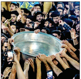
علی‌اصغر (ع) و حضرت رقیه (س) خوانده می‌شود.

یکی از کهن‌ترین آیین‌های عزاداری محرم در کشور آیین تشت‌گذاری یا تشت‌گردانی مردم اردبیل است. آنطور که می‌گویند نخستین تشت‌گذاری شهر پس از نماز مغرب روز بیست‌وهفتم ذی‌الحجه در مسجد جامع شهر اجرا می‌شود. زنان محله چند روز قبل از ۲۷ ذی‌الحجه اقدام به نظافت مسجد جامع می‌کنند و سپس تشت‌ها را در گوشه‌های مسجد قرار می‌دهند.