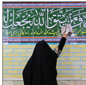
درست می‌کنند و به دیوارها و کف مسجد می‌مالند.

بعضی از مردم در مراسم نظافت و غبارروبی مسجد، حسینیه و تکیه محل خود شرکت می‌کنند. این مراسم از چند روز قبل از محرم شروع می‌شود و به جز زنان و دختران، جوانان هم با شور و شوق در آماده‌سازی و سپه‌پوش کردن این مکان‌ها شرکت می‌کنند و حاجت می‌طلبند. برای نمونه در روستاهای شوقان جاجرود، فریق خمین و شهرستان قروه کردستان در آستانه ماه