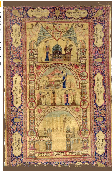
فرش یهودی باف در موزه تاریخ آستراخان

فرش تهران است که از روزگار قدیم مشتریان خاص خودش را داشت و هنوز هم می‌توان نمونه‌های این فرش‌ها را در برخی خانه‌های تهران پیدا کرد. بنابراین، روایت اورلئوس از خرید و فروش فرش‌های یهودی باف در بازارهای سنتی ایران صحیح به نظر می‌رسد و یک منبع تاریخی معتبر و قابل اعتماد به حساب می‌آید. آنطور که از سایر شواهد تاریخی پیداست، دماوند به‌طور دقیق‌تر گیلوند، کانون اصلی آفرینش قالی‌های یهودی باف بوده است.»