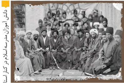
دانش‌آموزان مدرسه اسلام در کنار استادان

ساموئل بنجامین، نخستین سفیر آمریکا در ایران که در دوره ناصرالدین شاه عازم تهران شد هم در خاطراتش به فرش ابریشمی و نفیسی در تالار آینه و مقابل تخت طاووس در کاخ گلستان اشاره می‌کند. او ادعا می‌کند که در بافت این فرش، دانه‌های مروارید به کار رفته و با ارزش‌ترین فرشی بوده که در تهران دیده است.