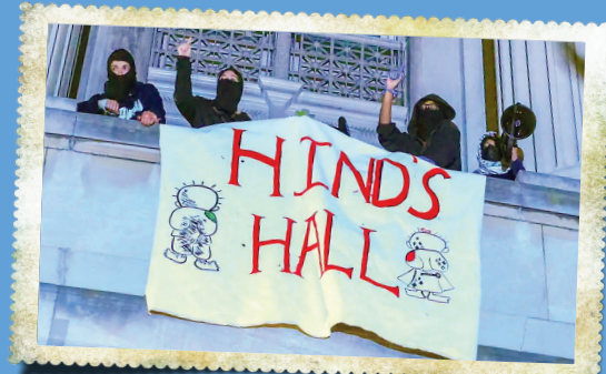
دانشجویان دانشگاه کلمبیا در امریکای شمالی در دست گرفته‌اند که تصاویری از حفظه روی آن نقش بسته است. دانشجویان در امریکای شمالی ماه‌های اخیر، یکی از فعال‌ترین گروه‌های حامی مردم غزه در غرب بوده‌اند.