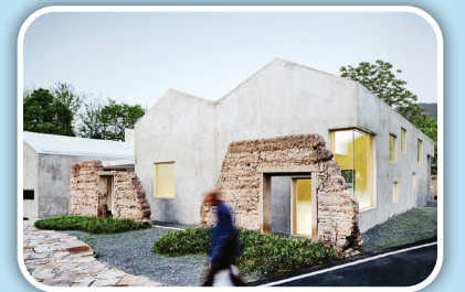
همزیستی سنت با هنر مدرن

در روزگار کنونی، گروهی از آدم‌ها در دنیای مدرن، معتقدند باید با سنت خداحافظی کرد و دست‌های هم حرفشان این است که نوگرایی، گلی به سرمانی زنده و باید به گذشته بازگردیم. برخی هم حرف حسابشان این است که باید به جای جنگ میان سنت و مدرنیسم، میان این دو، آشتی برقرار کرد و دستشان را توی دست هم گذاشت. نتیجه این تفکر را در دنیای هنر، علم و حتی دنیای معماری می‌توان دید. نمونه‌اش، بناهایی است که از ترکیب بقایای خانه‌های گلی باستانی در روستای وانگو در استان زنجان چین با سازه‌های مدرن بنا شده و در معرض دید علاقه‌مندان قرار گرفته است؛ بناهایی چشم‌نواز از دوستی میان سنت و مدرنیسم. مؤسسه طراحی و تحقیقات معماری دانشگاه زنجان، در این پروژه، بر حفظ بقایای دیوارهای گلی باستانی برجای مانده در این روستا تأکید دارد و آنها را با سازه‌های بتنی جدید، ادغام کرده و ساختمان‌هایی تلفیقی و زیبا خلق کرده است. بدینسان نباید کاربرد این ساختمان‌های تلفیقی، مناسب فعالیت‌های امروزی مثل ورزش، تفریح، نمایش فیلم و... است.