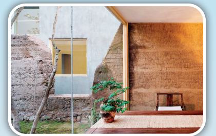
دیوارهای قدیمی، به گونه‌ای جانیابی شده‌اند که ساکنان درون خانه هم از دیدن آنها از پشت پنجره‌ها لذت می‌برند.