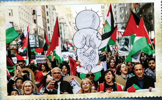
مردم مادرید، در یک راهپیمایی همبستگی با مردم غزه، تصویری ساخته‌شده از حفظه را روی دستگیرفته‌اند. اسپانیا یکی از کشورهای است که حمایت آشکاری از مردم فلسطین کرده و به صورت دیپلماتیک هم علیه رژیم صهیونیستی موضع گرفته است. در اینجا هم حفظه نماد همبستگی با فلسطین است.

جوانمردی جنایت‌های رژیم صهیونیستی در چند ماه اخیر علیه مردم غزه، خون مسردم آزاده دنیا را به جوش آورده و هر کدام دنبال راهی هستند تا همبستگی خود را با مردم مظلوم فلسطین ابراز کنند. بسیاری از آنها برای این کار در نهایت به یک راه حل ساده و محبوب رسیده‌اند: استفاده از تصویر حفظه، شخصیت کار تونی محبوب و مشهوری که دهه‌ها در خاورمیانه نماد مقاومت فلسطین بوده و حالا در دنیا هم به شهرت رسیده است. در آخرین نمونه، یک خواننده تر کیه‌ای در کنسرت خود تصویر بزرگی از حفظه را روی صفحه‌های نمایشگر انداخته و تیشرتی با تصویر او به تن کرده است. اما این تنها یکی از صدها موردی است که مردم برای ابراز همبستگی خود با فلسطین از تصویر حفظه استفاده کرده‌اند. حفظه بسری پاپر هنر با لباس‌های وصله‌خورده است که دست‌به‌کمر پشت به مردم کرده و مخوم و در عین حال امیدوار، به گذشته و آینده فلسطین نگاه می‌کند. این شخصیت کار تونی راناجی العلی، کار نویسندگی فلسطینی در سال ۱۹۶۹، ۱۹ سال بعد از جنگ مشهور اعراب و اسرائیل خلق کرد و نامش را حفظه گذاشت. نام حفظه از گیاهی بومی در فلسطین گرفته شده که ریشه عمیق و مزه تلخ دارد. خود ناجی العلی یکی از سرشناس‌ترین کار نویسندگی‌های عرب دنیا بود؛ اما پایان تلخی داشت و در سال ۱۹۸۷ در لندن به قتل رسید و پرونده او هنوز حمایت می‌کند.