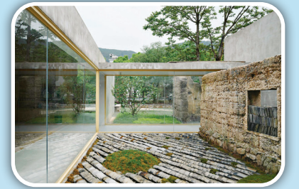
نمایی از فضای حیاط داخلی یک خانه، همراه با خاطرهای از روزگار کهن