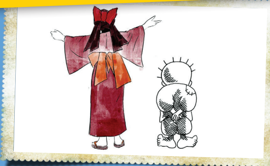
«در کنار حفظه»، مدت‌هاست یک کارزار اینستاگرامی در سراسر دنیا راه افتاده که هنرمندان و علاقه‌مندان با هشتگ "#withHandala" شخصیت‌های کار تونی خود را با الهام گرفتن از حفظه می‌کشند و برای همبستگی با مردم فلسطین منتشر می‌کنند. این عکس، تصویری است که یک هنرمند ژاپنی با این هشتگ کشیده است.