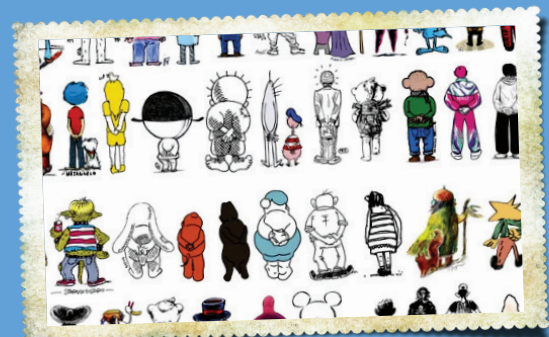
در ایتالیا کارزارهای راه افتاده که کودکان و علاقه‌مندان، با الهام از حفظه، شخصیت‌های مشابهی را خلق کنند. نام این کارزار «بدون پرچم و متحد برای حفظه» درخواست فوری آتش‌بس بود.