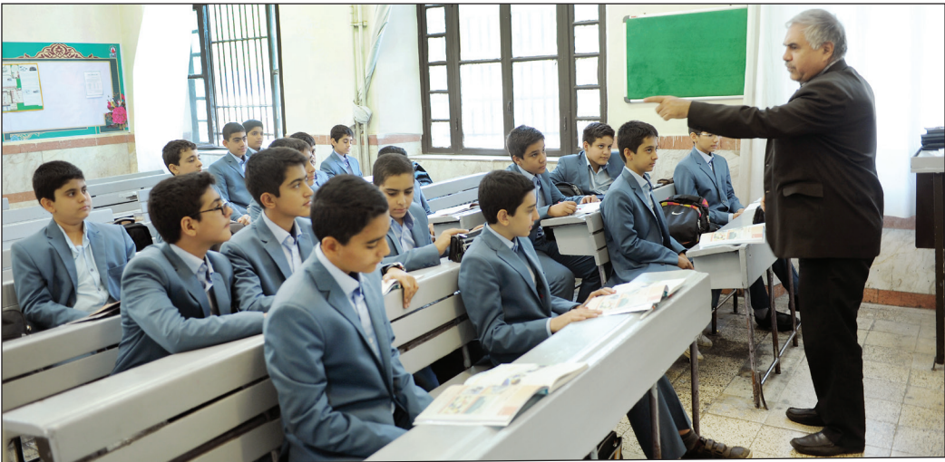
گزارش: بیل شریف روزنامه‌نگار

به گفته رئیس مرکز پژوهش‌های مجلس، در سال ۱۴۰۲ از ۵۷ هزار مجوز استخدام معلمان مرد بیش از ۱۰ هزار ردیف خالی ماند