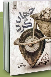
عنوان کتاب: جهادگرد نام نویسنده: حسن ذوالفقاری ناشر: کتابستان معرفت

حاج عبدالله والی از مشهورترین جهادگرانی بود که عمر خود را صرف خدمت رسانی به مناطق محروم کرده بود. کتاب «تا خمینی شهر» که به شرح زندگی و فعالیت مجاهدانه مرحوم عبدالله والی می پردازد، نمونه‌ای از شیوه زندگی پرتلاش جهادگران برای آبادانی کشور عزیزمان است. این کتاب در بخش‌های مختلف خود روایتی مستند از زندگی خانوادگی و نیز اجتماعی فردی را به تصویر می کشد که مانند سایر مردم برای دفاع از کشورش به مناطق جنگی رفته بود ولی در پی درخواست حضرت امام (ه) تمام زندگی خود را وقف محرومیت زدایی کرد.