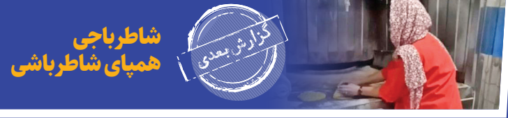
شاطر باجی همپای شاطرباشی

خمیر تافتون را که در سینی چرخان تور صنعتی جاگیر می‌کنند، یک دور بیشتر تاب نمی‌دهند؛ یک دوری که کمتر از ۴۰ ثانیه زمان می‌برد. دور ثانیه‌ای و کوتاه که تمام می‌شود. خانم شاطر، خمیر به نان داغ و تازه تافتون تبدیل شده را با کاردک از کف پر حرارت سینی تور جدایی می‌کند و با احتیاط طوری که دستش نسوزد آن را برمی‌دارد تا روی توری فلزی میز سردکن برای مشتری‌ها بگذارد.