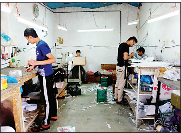
کارگاه تولید کفش در شیرین‌آباد

روستای «شیرین‌آباد» در فراهان استان مرکزی از ابتدای دهه ۸۰ به قطب تولید کفش بچگانه در کشور تبدیل شده است