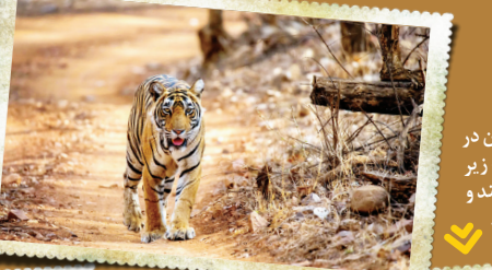
گره نترس بیرها، گره‌سانانی هستند که بدون نگرانی در پارک ملی «رانتامپور» در راجستان هند قدم می‌زنند و می‌دانند هیچ موجودی جرات نمی‌کند به طریشان برود؛ غیر از انسان‌ها!