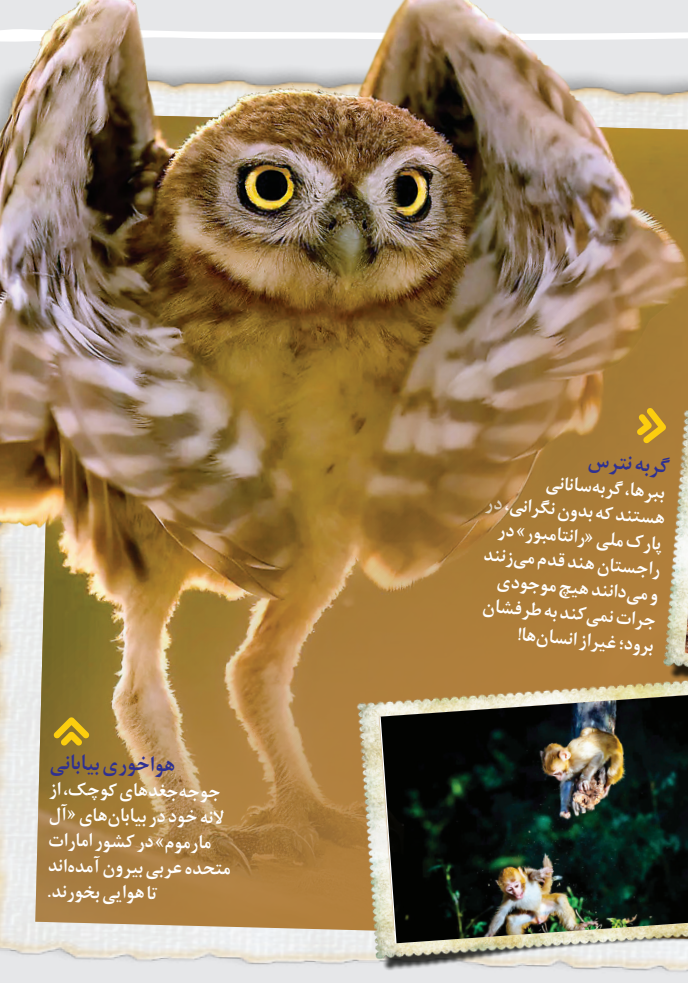
هواخوری بیابانی جوجه‌جنگلهای کوچک، از لانه خود در بیابان‌های «آل ماروم» در کشور امارات متحده عربی بیرون آمده‌اند تا هوایی بخورند.