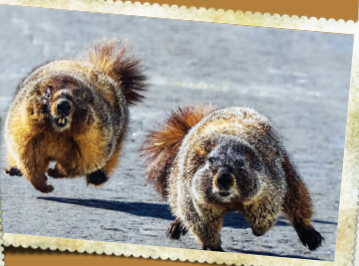
المیک موش خرماها المیک موش خرماها، حالا در کوه‌های راکی در ایالات متحده در حال برگزاری است.