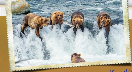
شام سرکاری یک ماهی سالمون در پارک ملی «گاتما» در آلاسکا ۵ خرس گرسنه را سر کار گذاشته است.

موجودات در حیات وحش، ارزش‌های مشترکی با انسان‌ها دارند؛ حفظ بقا، تفریح و رقابت، آرامش، اخرس‌ها هم مثل ما انسان‌ها، برای تهیه شام‌شان باید تلاش کنند و موش خرماها هم نیاز به تفریح و مسابقه دارند و قو‌ها هم آرامش بخش‌اند. این تصاویر، بهترین شکارهای عکاسان حیات‌وحش در هفته قبل است که می‌بینید.