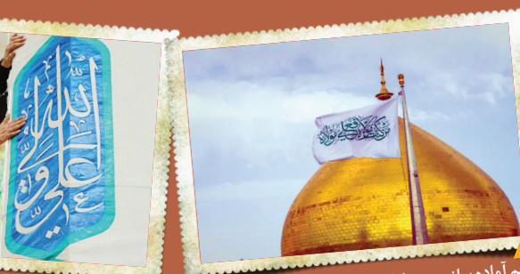
مراسم آماده سازی حرم امام علی (ع) برای عید غدیر، چند روز پیش با برافراشتن این پرچم رسماً شروع شد.

شیعیان فردا در هر جای دنیا که باشند، دلشان برای یک شهر و یک گنبد طلا می‌تپد؛ در روز عید غدیر، روزی که ماجرای عاشقی ما و مرتضی علی (ع) آغاز شد، چه جای بهتری می‌توان در دنیا پیدا کرد که عطر امیر المومنین بیشتر در آن پیچیده باشد؟ بارگاه امیر المومنین، همینطور هم صفا و حلال دگرگون کننده‌ای دارد اما به مناسبت عید، چند روزی است که خادمان حرم، به عطر افشانی و غبارروبی آن