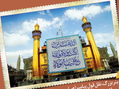
نصب انواع کتیبه و بنر، بخشی از برنامه آماده سازی حرم امیر المومنین (ع) برای عید امسال است.