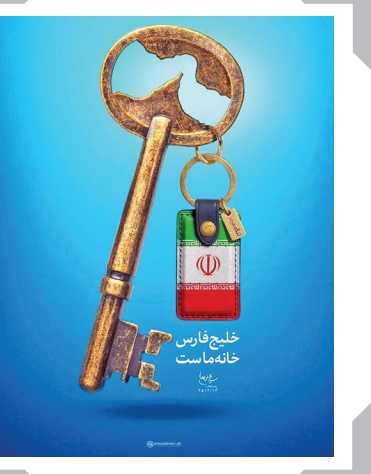
خلع فارس خانه هاست