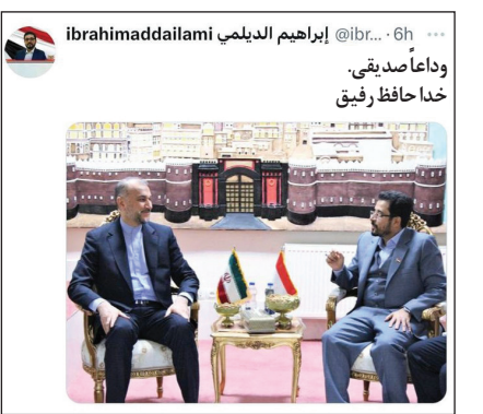
سفیر یمن در ایران

چه چهره‌های سرشناس و چه مردم عادی؛ واکنش‌ها در توییت‌ها به شهادت حسین امیر عبداللہیان بسیار زیاد بوده. همکاران داخلی و خارجی وزیر خارجه، به او ادای احترام کرده‌اند و مردم عادی با حسرت، از فقدان ناباورانه او نوشته‌اند.