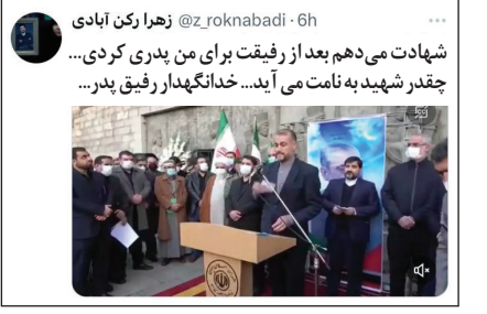
دختر شهید رکن آبادی