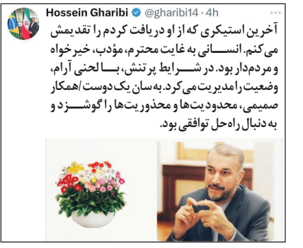
سفیر سابق ایران در برزیل