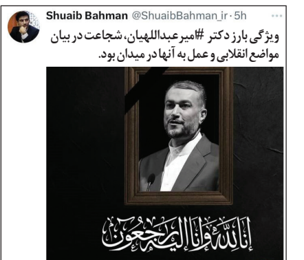
تحلیگر مسائل بین الملل