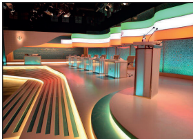
دکور مناظره سال ۹۶

بود و از دیگر کارهایش می‌توان به برنامه جام جهانی، اتفاق، ایرانشر، پنج ستاره، شوکران، برنامه‌های سال تحویل و برنامه‌های «عصر جدید» و «محفل» است.