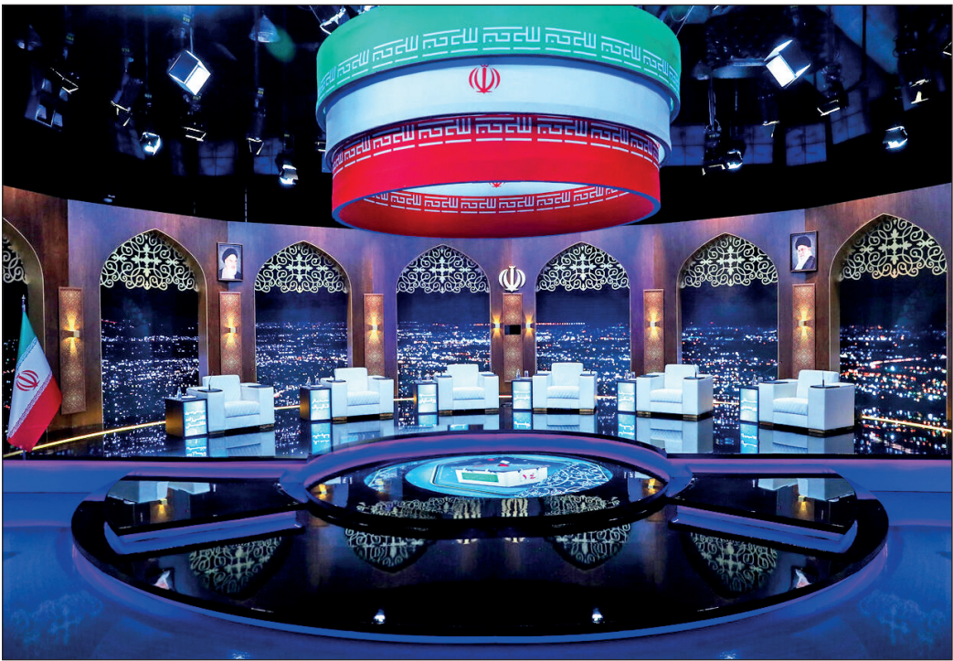
دکور مناظره سال ۱۴۰۳

شیوه طراحی دکورها در لحظاتی نامزدهای ریاست جمهوری را به در دسر انداخت