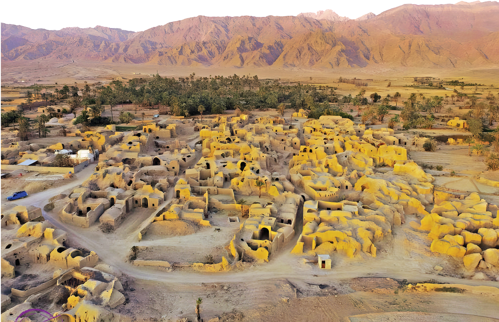
بافت قدیم روستای اصفهک