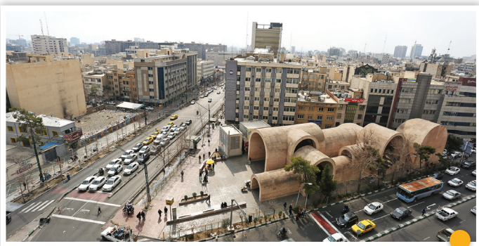
جایزه جهانی برای میدانگاه آجری

«محلهمان نوساز است، اما امکاناتی نداریم» این کلمه بسیاری از ساکنان شمال غرب پایتخت در دیدار با مسئولان بود. همین هم باعث شد تا مدیریت شهری عزمش را برای ارتقای سراسر خدماتی در این محدوده از پایتخت جزم کند. نمونه‌اش هم راه‌اندازی بازار میوه و تره‌بار زاگرس در بلوار ار دستانی، خیابان کرمانشاه است که در یکصدویستمین پویش امیدوافتخار افتتاح شد.