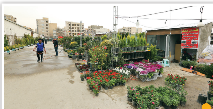
بازار گل به غرب رسید

برای احداث ساختمان سرای محله باغ فردوس در منطقه یک تهران، این چنار زیبای ۸۰ساله که صاف وسط نقشه قرار گرفته بود، باید قطع می‌شد. اما اصرار شهرداری منطقه یک تهران برای حفظ درخت باعث شد پیمانکار با تغییراتی در نقشه، این درخت قدیمی را در دل بنای سرای محله حفظ کند تا زیبایی آن چندبرابر شود.