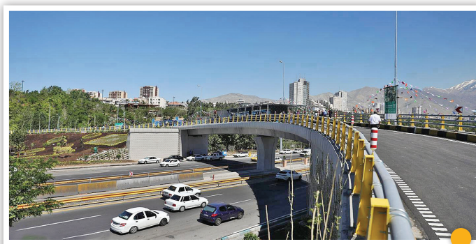
مسیر دور زدن کوتاه‌تر شد

میدانگاه جهاد سال گذشته یک جایزه جهانی به نام خود ثبت کرد که همان جایزه معتبر دنیا با عنوان دیزین است. در این میدان ورودی ایستگاه متروی آن از ۳۰۰ هزار آجر دست‌ساز برای ایجاد منظر شهری استفاده شد. این پروژه به جز جلب توجه مسافران درون شهری، از جنبه‌های زیباشناسی و معماری حرف‌های زیادی برافشانی کرده است.