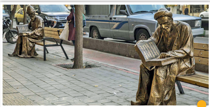
تندیس‌های نیمکت‌نشین در مسیر کتابخوان‌ها

افتتاح پروژه‌های کوچک و بزرگ، تقاضای بسیاری از شهروندان ساکن تهران است که نیازمند توسعه بیشتر زیرساخت‌ها و امکانات محل زندگی خود هستند. این پروژه‌ها در شهرداری بررسی و به تناسب طرح‌های توسعه کلان اجرا می‌شوند. در چند قاب بخشی از طرح‌های اجرایی در محله‌های مختلف پایتخت را می‌بینید