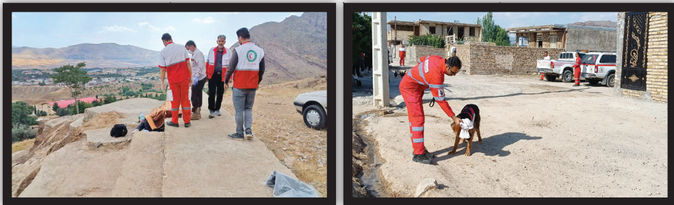
گزارش روزنامه‌نگار محمد جعفری

۲ روز جست‌وجو برای یافتن دختر نوجوانی که به طرز عجیبی مفقود شده بود پایان تلخی داشت و با کشف بیکری بی‌جان او همراه بود.