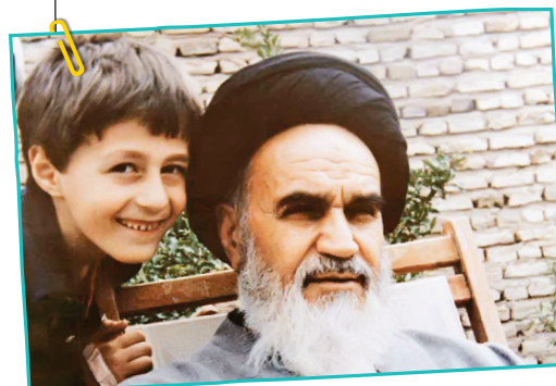
امام در کنار سیدحسین خمینی

در این ضمیمه تلاش کرده‌ایم به گوشه‌ای از نکات برگرفته از سیره و سبک زندگی ایشان اشاره‌ای کنیم. برای شناخت بهتر شخصیت والای امام خمینی(ره) هم بجاست نگاهی به منش و رفتار ایشان در جمع همسر و فرزندان و عروس و دامادها و... داشته باشیم. کسانی که سالیانی دراز در کنار امام خمینی(ره) بودند همگی به حسن رفتار امام راحل در محیط خانواده گواهی داده‌اند. باشد که الگوی عملی برای تک‌تک ما پیروان امام و مکتب خمینی باشد.