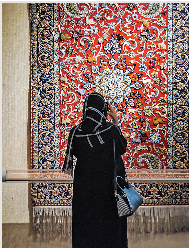
فرشی با گل‌های نقش برجسته