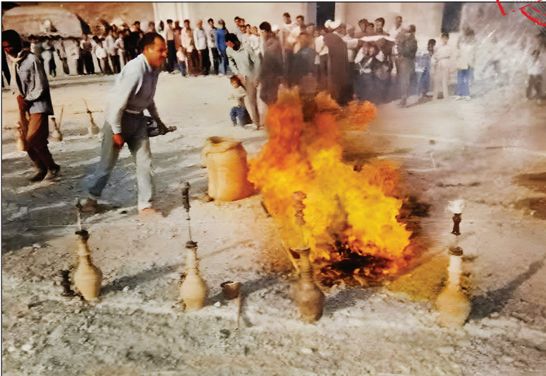
اهالی بلبل آباد در سال ۱۳۷۰ در یک تصمیم جمعی دخانیات را کنار گذاشتند

زندگی بدون دخانیات برای اهالی روستا عادت شده، اما برای تازه‌واردها عجیب است. هیچ فردی در این روستا هیچ نوع دخانیات و موادمخدری استفاده نمی‌کند و تازه‌واردها به قانون روستا احترام می‌گذارند. قیل از جشن روستای بدون دخانیات، کشاورزان بلبل آباد تنباکو کشت می‌کردند، اما