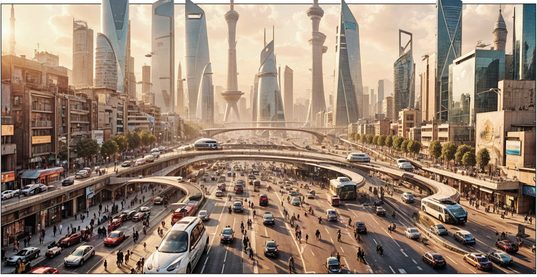
خیابان‌های تهران ۱۶ سال دیگر شاید چنین چهره‌ای داشته باشد. طرح: هوشن آگری

جهان دائماً در حال تغییر است. این تغییرات گاهی در طول هزاران سال بسیار ناچیز بوده‌اند. اما تغییرات در جهان از اواخر قرن نوزدهم شتاب بسیار زیادی گرفته است. در سال‌های اخیر، تغییرات به قدری مشهود و مکرر بوده‌اند که می‌توان به‌راحتی گفت یک روز در زمان حال، بیشتر از شاید ۱۰ سال در زمان‌های بسیار گذشته، تغییرات به‌همراه دارد. با در نظر گرفتن همه این موارد، جالب خواهد بود که فرض کنیم زندگی ما در ۲۶ سال بعد، یا به‌طور مشخص در سال ۲۰۵۰ میلادی (۱۴۲۹) چگونه خواهد بود.