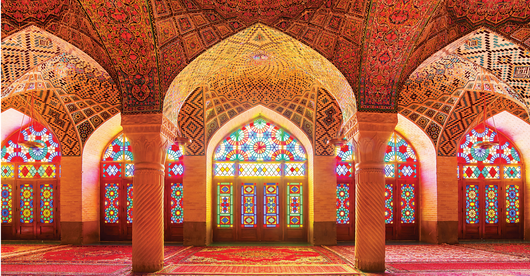
کار کاشی در مسجد نصیر الملک شیراز با کاشی هفت رنگ استفاده شده است