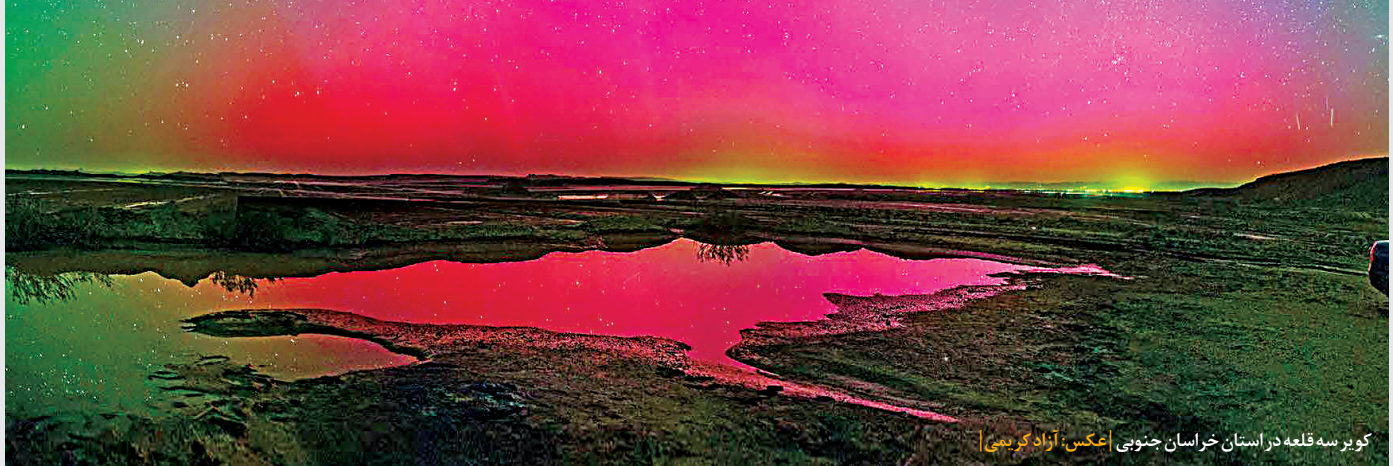
کویر سه قلعه در استان خراسان جنوبی

چرا در ایران؟ اداره ملی اقیانوسی و جوی آمریکا (NOAA) هفته گذشته، اطلاعاتی صادر کرد و خبر از توفان شدید و ژئومغناطیسی