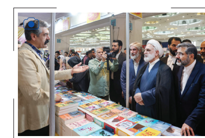
بازدید رئیس قوه قضاییه از نمایشگاه کتاب تهران غلامحسین محسنی اژه‌ای، رئیس دستگاه قضا از سی و پنجمین نمایشگاه کتاب تهران بازدید کرد. وزیر فرهنگ و ارشاد اسلامی وی را در این بازدید همراهی می‌کرد.