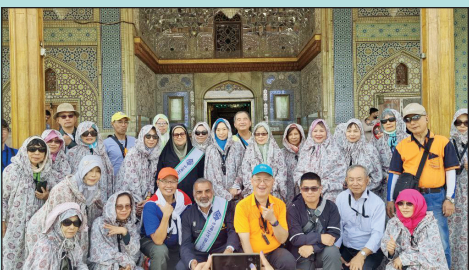
گروه کودکان و بزرگسالان در حرم حضرت شاهچراغ