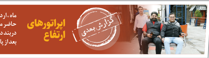
گزارش میدی ارتقاء ایبراتورهای