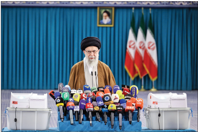
رأی رهبر معظم انقلاب در اولین ساعات رأی‌گیری