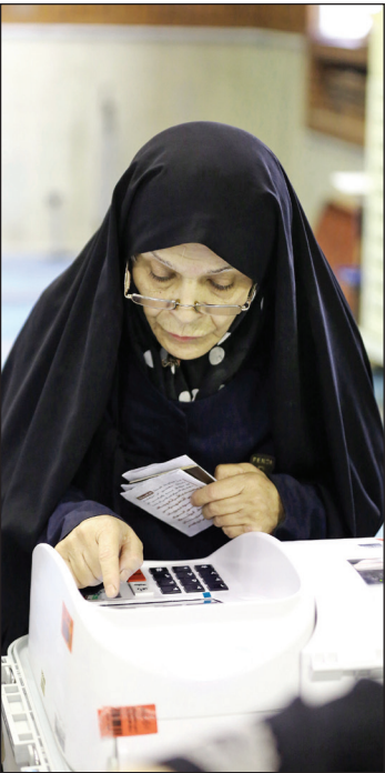
مشارکت افراد سالخورده، یکی از قاب‌های نمایشی انتخابات