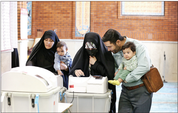
دورهمی خانواده‌های پای صندوق‌های رأی الکترونیک

یکی از ویژگی‌های مهم دور دوم انتخابات مجلس دوازدهم بر گزار «تمام‌الکترونیک» فرایند رأی‌گیری در ۲۵ هزار و ۷۰۰ صندوق رأی در ۸ حوزه انتخابیه، شامل «تبریز، آذرشهر و اسکو»، «تهران، ری، شمیرانات، اسلامشهر و پردیس»، «آبادان، شیراز، کرمانشاه، خرم‌آباد، قائمشهر و ملایر» بود. براین اساس رأی حدود ۶۰ درصد کاندیداها در این دور انتخابات به‌صورت تمام‌الکترونیک ثبت شد. اگرچه در گذشته، فرایند احراز هویت به‌صورت الکترونیک انجام می‌شد و تنها تعرفه‌های رأی به شکل کاغذی دریافت می‌شد، در این دور از انتخابات اما برای نخستین بار از دستگاه اخذ رأی الکترونیک هم استفاده شد. در چنین شرایطی اما بررسی‌ها از موفقیت‌آمیز بودن رأی‌گیری الکترونیک و استقبال مردمی از این شیوه حکایت دارد، فرایندی که تأیید مقام‌های شورای نگهبان و وزارت کشور را نیز به‌عنوان رکن‌های نظارتی و اجرایی انتخابات به‌دنبال داشته است. بر این اساس هم بود که مسئولان مربوط در وزارت کشور و شورای نگهبان در گفت‌وگوهایی از فرایند رأی‌گیری تمام‌الکترونیک ابزار رضایت کردند. با توجه به چنین تجربه موفق هم بود که مقام‌های وزارت کشور اعلام کردند با هماهنگی شورای نگهبان، به‌دنبال برگزاری انتخابات ریاست جمهوری به‌صورت الکترونیک هستند. نتیجه موفقیت‌آمیز بر گزار انتخابات الکترونیک در شرایطی است که طی سال‌های اخیر زیرساخت‌های لازم برای تحقق این موضوع فراهم شده است. به‌گفته مقام‌های ارشد وزارت ارتباطات، طی بیش از ۲ سال گذشته، حدود ۱۰ هزار روستا به شبکه ارتباطات متصل شده‌اند، اقدامی که مسئولان از استمرار آن خبر می‌دهند.