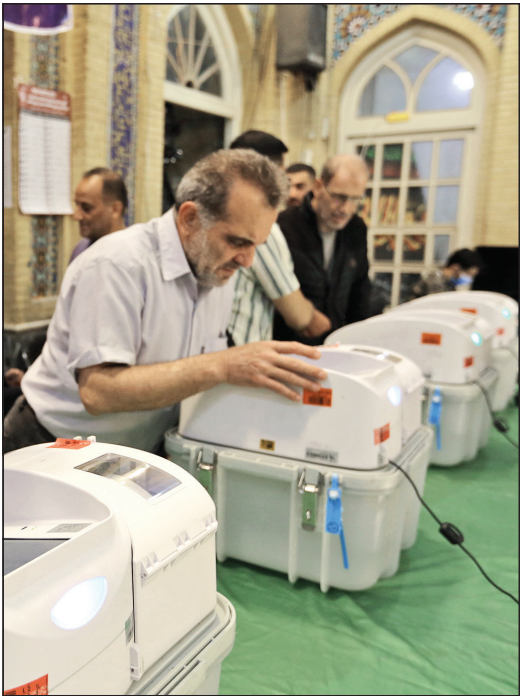
حضور مردم در پای صندوق‌های رأی الکترونیک