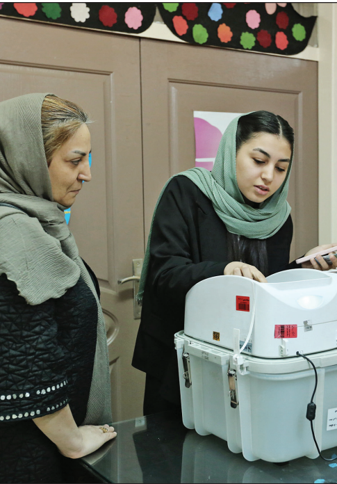
حضور اقشار مختلف در دور دوم انتخابات