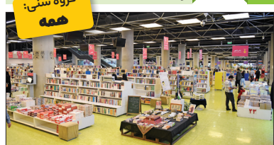
گروه سنی: همه