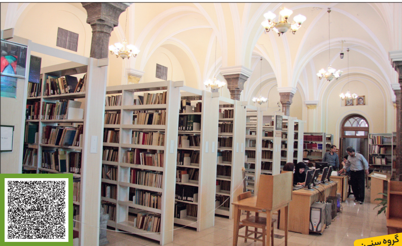
گروه سنی: بزرگسالان

در این کتابخانه ۵۱۰ هزار کتاب چاپی، ۲۴ هزار کتاب خطی، بیش از ۴۱ هزار مجلد نشریه ادواری و میلیون‌ها برگ سند نگهداری می‌شود؛ اما بخش جذاب دیگر موزه و در کنار آن