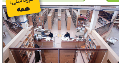
گروه سنی: همه