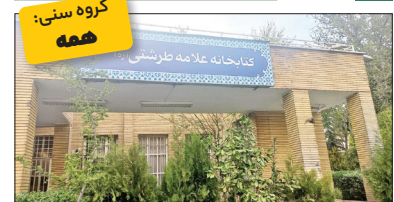
گروه سنی: همه