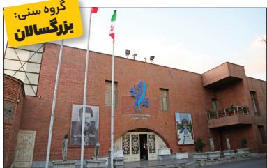
گروه سنی: بزرگسالان