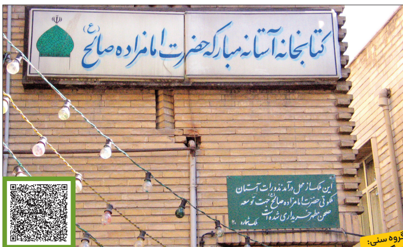
گروه سنی: بزرگسال

در کنار همه جذابیت‌های آستان امامزاده صالح (ع) برای علاقه‌مندان به مطالعه جز کتابفروشی‌های اطراف، کتابخانه وابسته به آستان برای خودش خاص است. کتابخانه سال ۱۳۶۲ در ۲ طبقه ساخته شد و بیش از ۲۰ هزار جلد کتاب دارد. طبقه اول کتابخانه