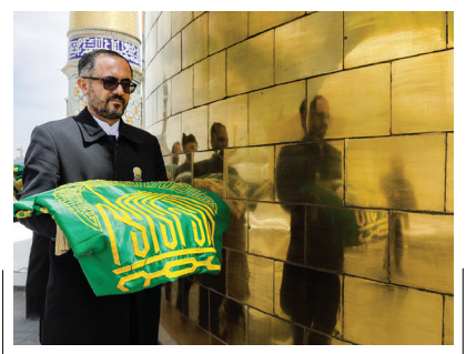
کاروان‌های زیرسایه خورشید در کنار خورشید آستانه دهه کرامت و ایام میلاد باسعادت حضرت امام رضا (ع)، جمعی از خادم بارگاه منور رضوی با حضور در کنار گنبد مطهر امام هشتم (ع)، پرچم‌های کاروان‌های زیر سایه خورشید را متبرک کردند.