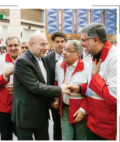
گرامیداشت روز جهانی هلال احمر مراسم گرامیداشت روز جهانی هلال احمر و صلیب سرخ روز چهارشنبه (دیروز) با حضور محمدباقر قالیباف، رئیس مجلس در مرکز همایش‌های نورالرضاع، برگزار شد.