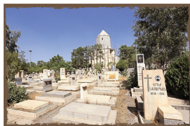
■ موضوع: گورستان‌های دولاب ■ ویژگی: محل دفن چهره‌های معروف