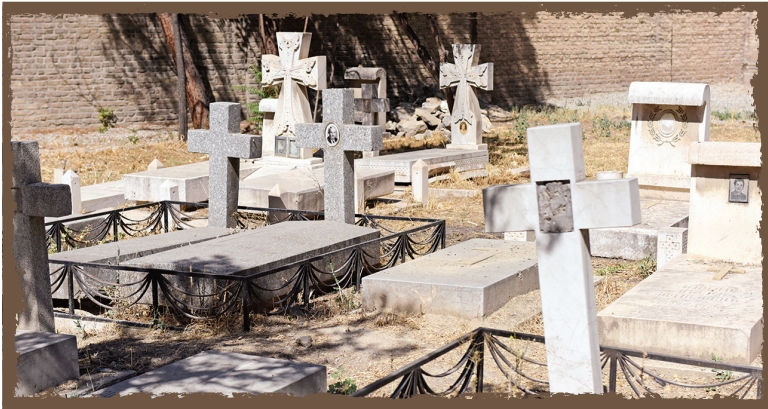
■ موضوع: ارامنه دولاب ■ ویژگی: برگزاری مراسم خاص مذهبی

آبادی کهن دولاب در تاریخ پر و پیمان خود پذیرای اقوام و مهاجران بسیاری از نقاط مختلف کشور بود. وجود گورستان قدیمی ارامنه در اراضی دولاب، یکی از مهم‌ترین نشانه‌هایی است که گواهی می‌دهد زندگی ارامنه در دولاب قدمت بسیار دارد. به عبارت دیگر، دولاب نخستین آبادی یا گستره‌ای است که پس از مهاجرت جمعی از ارامنه به تهران میزبان آنها شد. علیرضا زمانی، تهران پژوه، می‌گوید: «کوچ ارامنه از نقاط مختلف به محله‌های پایتخت، زمینه‌ساز شکل‌گیری یا توسعه برخی محله‌ها شد؛ محله‌هایی چون مجیدیه، زرکش و... که هنوز به محله‌های ارامنی‌نشین پایتخت معروفند. اما ماجرای ارامنه و دولاب، داستان متفاوتی دارد. این محله که روزگاری آبادی بزرگی بود در بیخ گوش تهران، نخستین محله یا گستره‌ای از تهران است که ارامنه در آن ساکن شده‌اند. رد پای کوچ ارامنه به دولاب را باید در دوران زنده و زمان حکومت کریم‌خان زند جست‌وجو کرد. در این دوران به دستور حاکم وقت ۱۰ خانواده ارامنی که همگی سنگ‌تراش‌هایی ماهر بودند از جلفای اصفهان به دولاب آمدند و سنگ‌بنای سکونت‌شمار بیشتری از ارامنه را در این آبادی نهادند.»