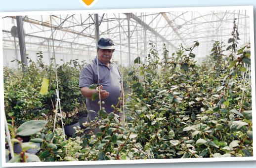
کلکسیون میوه های گلخانه ای

سلیقه مشکل پسند اهالی فیلیستان سبب شده در گلخانه های این روستا فقط میوه های باب طبع و لب و دندان لاکچری خوران پرورش پیدا کند.