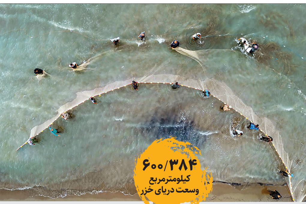
عکس: همشهری/احسان افشاری/اسفند

۱۲۲ هزار تن آلاینده نفتی و هزاران تن فاضلاب و سموم کشاورزی هر سال وارد خزر می‌شود