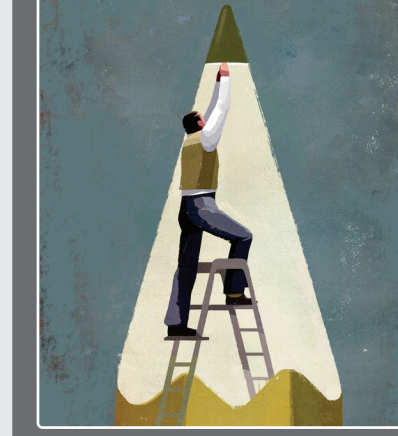
اثر: استوارت مک ریث/ انگلیس