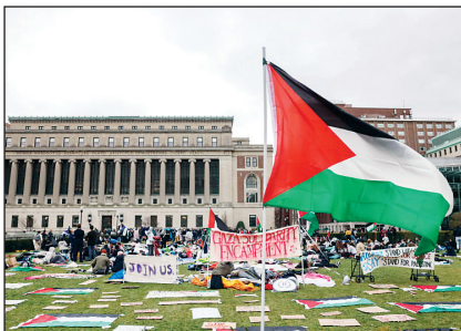
گزارشک همشهري صهيونيستي

منابع: الجزیره، عربی ۲۱، مرکز اطلاع‌رسانی فلسطین، روزنامه کالکالیست، ه‌آر تی، بی‌دعوت آخارونوت، اندیشکده واشنگتن