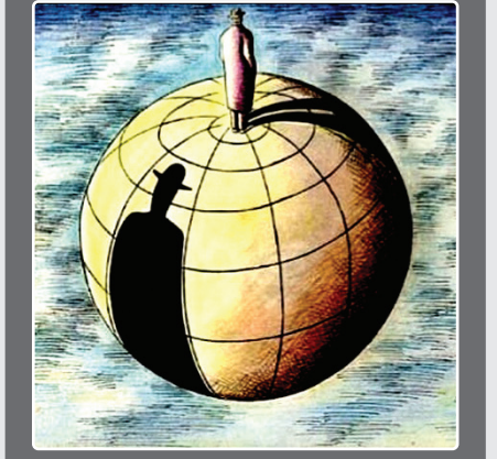
اثر: جواد علیزاده