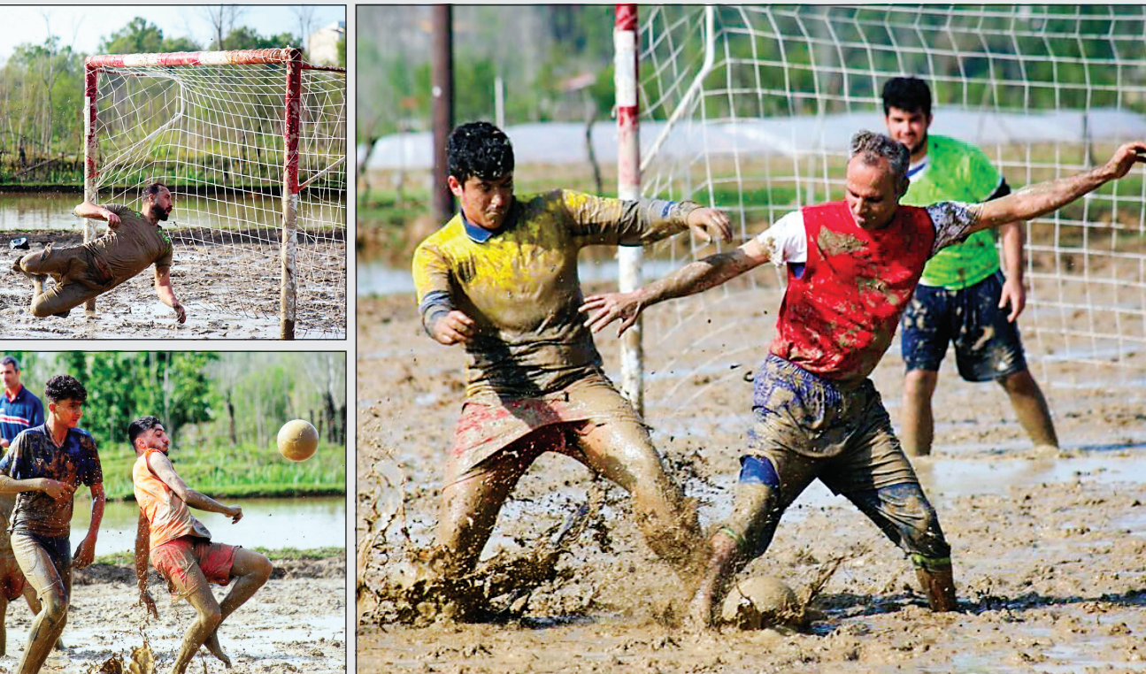
در آغاز فصل کشت برنج، جوانان روستا در زمین شالیزاری مسابقه فوتبال برگزار می‌کنند تا فصل برنج را با شادی آغاز کنند. اولین دوره مسابقات فوتبال در روستای چماچای شرف برگزار شد.