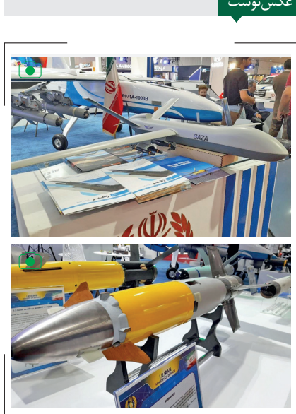
نمایشگاه بین‌المللی امنیت و دفاع بغداد با حضور نمایندگان نظامی ۲۲ کشور از جمله وزارت دفاع و پشتیبانی نیروهای مسلح کشورمان برگزار شد.