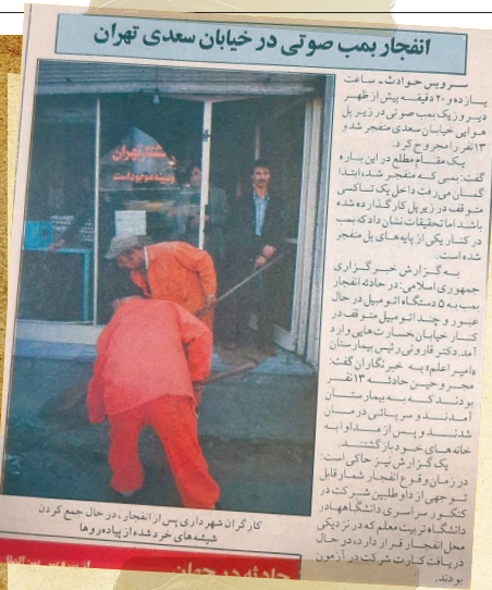
انفجار بمب صوتی در خیابان سعدی تهران