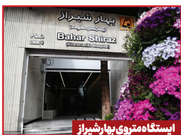
ایستگاه متروی بهار شیراز

خبر خوب این است که ورودی مترو از ضلع جنوبی در ماه‌های ابتدایی سال آینده به بهره‌برداری خواهد رسید. همین مشکل را ایستگاه شهید قدوسی هم دارد که در سال آینده با افتتاح خروجی دوم حل خواهد شد. خروجی دوم ایستگاه صیاد شیرازی در ضلع غربی بزرگراه شهید صیاد نیز در دستور کار ساخت قرار دارد و ۱۲ ایستگاه دیگر یعنی ایستگاه بهار شیراز و ایستگاه سرباز نیز در سال آینده افتتاح خواهند شد. در کل می‌توان گفت سال آینده برای متروی منطقه ۷ یک سال به یادماندنی خواهد بود چون افتتاح‌های خوبی را در این منطقه خواهیم داشت. ایستگاه سرباز هم مانند ایستگاه بهار شیراز در خط ۶ مترو قرار دارد. پروژه ایستگاه سرباز در سال آینده افتتاح خواهد شد و تاکنون ۷۰ درصد پیشرفت فیزیکی داشته است. خروجی جنوبی