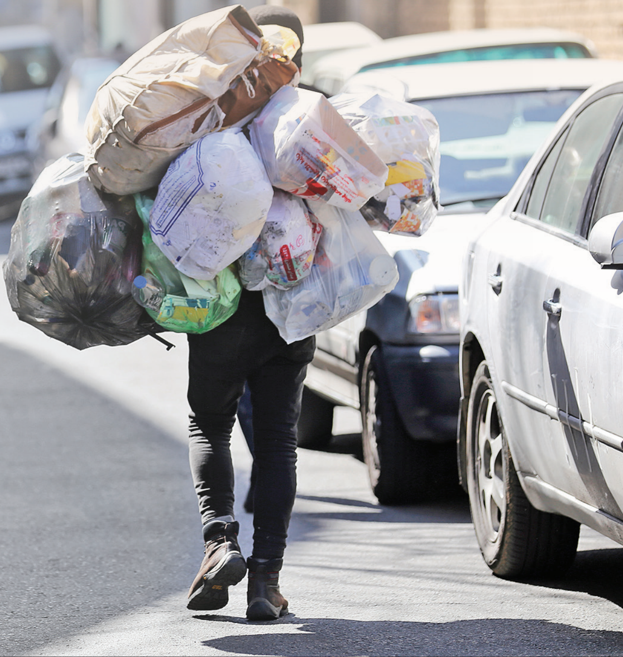
زباله‌گردی در تهران