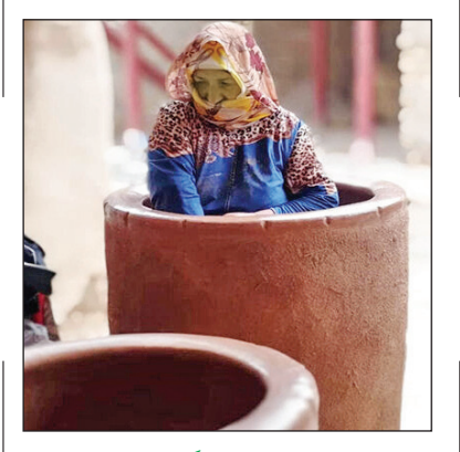
روستای تنورهای گلی سنتنی

گلایر، از توابع بخش مرکزی ایچرود در استان زنجان، روستایی پلکانی و سرسبز است. شغل مردان این روستا اکثرآ نانواپی است و زنان روستا نیز به ساخت ظروف سفالی می‌پردازند. تنورهای قد و نیم قد برای طبخ نان حاصل دست زبانی است که دوره میانسالی را سپری می‌کنند.