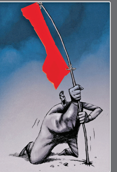
سوکت بالازار ترکیه