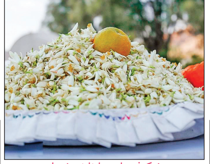
شکوفه‌های بهار نارنج شیراز

این روزها هوای شیراز مملو از عطر بهار نارنج است. این عطر از باغ‌ها و درختان نارنج در گوشه‌گوشه شهر به مشام می‌رسد. شکوفه‌های نارنج از نیمه فروردین باز می‌شوند و مردم را به باغ‌ها و زیر درختان نارنج باز می‌کشاند.